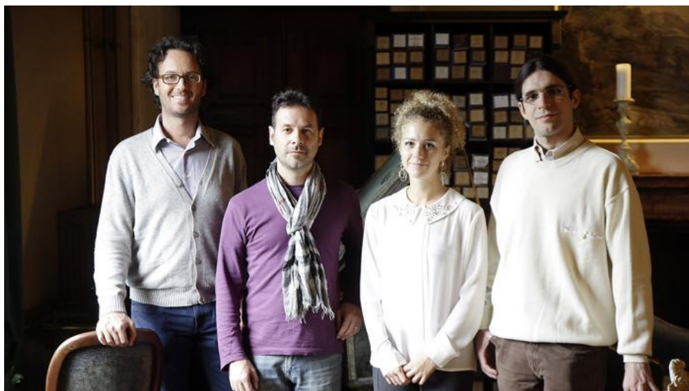
La squadra della start up emiliana vincitrice del Premio Marzotto

11/05/2015 Ora 4Innovation lancia start up dalla vista lunga